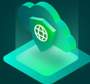
Public Cloud Protection

Universal Services: Migration, Automation and APIs