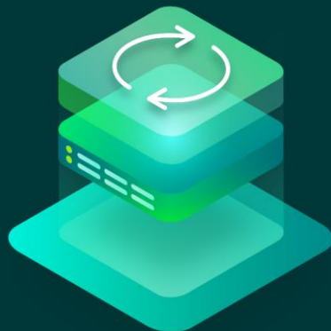
Off-site Backup & Disaster Recovery